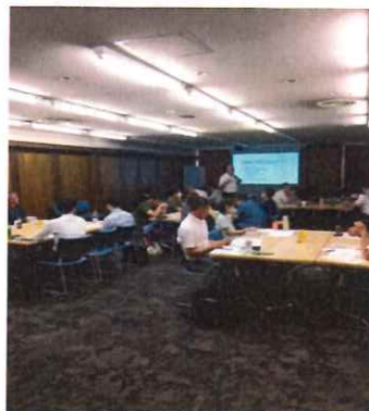
実践コース演習風景