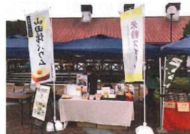
楽農フェア（楽農生活センター）