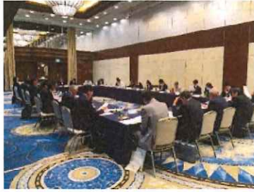
ブロック会議情報交換