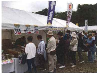
県民農林漁業祭（明石公園）