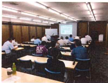
基礎コース講義風景