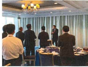
ブロック会議懇親会